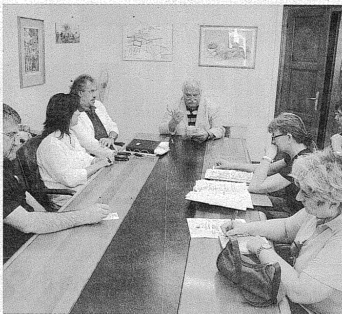
Il sindaco durante la presentazione del portale web