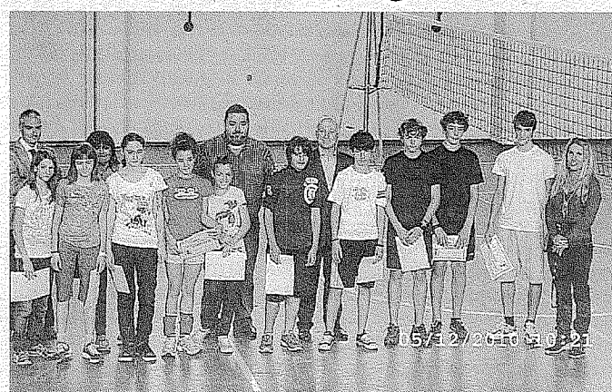
I ragazzi sono stati premiati in palestra